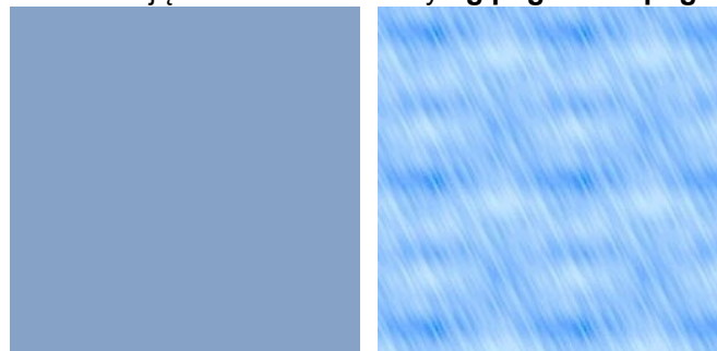
bg.png i table.png

5 / teraz zmienimy przykładowo istniejące w folderze obrazy bg.png i table.png na np.: